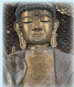
▲優しい瞳に癒されます☆