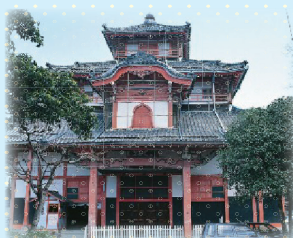
▲この建物にあの大きさの大仏は圧巻です

中に入ると想像を超えるその大きさに圧倒されます。寺院が窮屈ではないのかと思われるほどの圧倒感。「大銀杏を芯柱とし、木材で骨格を組んだのち、外部は竹材で表層は竹材で編み、粘土をぬった…」という説明は読んでいましたが、なによりそのお優しいお顔立ち👉