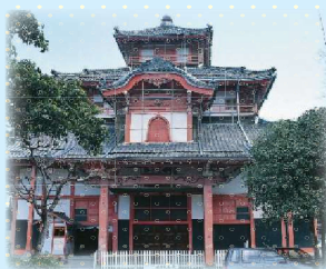
▲この建物にあの大きさの大仏は圧巻です

中に入ると想像を超えるその大きさに圧倒されます。寺院が窮屈ではないのかと思われるほどの圧倒感。「大銀杏を芯柱とし、木材で骨格を組んだのち、外部は竹材で表層は竹材で編み、粘土をぬった…」という説明は読んでいましたが、なによりそのお優しいお顔立ち👉