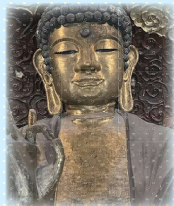
▲優しい瞳に癒されます☆