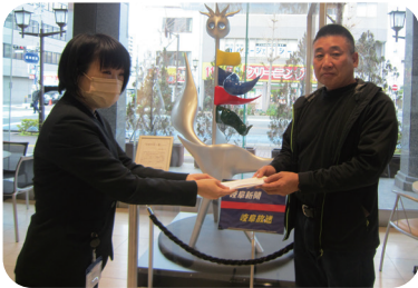
▲総支部長自ら岐阜新聞へ直接手渡し

△イベント収益などから 建連岐阜建設労働組合本巢 支部が、イベント収益と経費か ら計10万円。