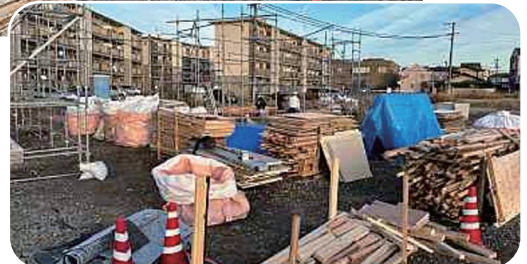
▲見事に解体されました