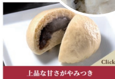
上品な甘さやみつき あんまん：300円