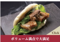
ボリューム満点で大満足 角煮まん：600円