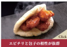
エビチリと包子の相性が抜群 エビチリまん：500円