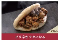
ピリ辛がクセになる 麻婆まん：400円