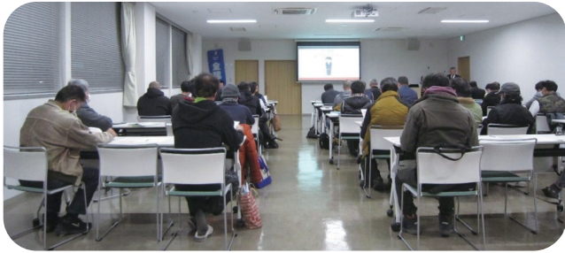
▲たくさんの方が最後まで聴講されました