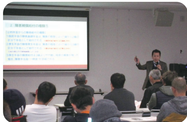
▲みなさん全集中で耳を傾けております 📢