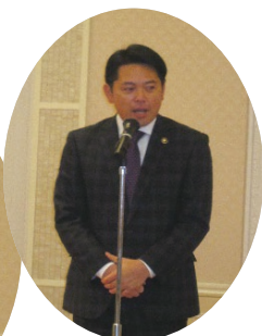
▲毎年かけつけていただける 柴橋岐阜市長