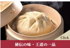
秘伝の味・王道の一品 肉まん：400円