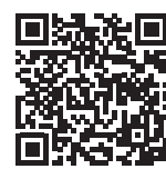
講習の受講資格、 講義科目・時間等