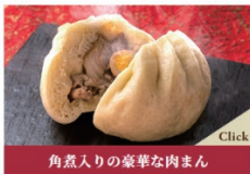
角煮入りの豪華な肉まん 特製肉まん：600円