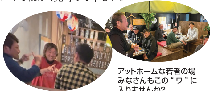
アットホームな若者の場 みなさんもこの“ワ”に 入りませんか？

青年部の役割は未来の母体役員の勉強だけではなく、新たなチャレンジだと思います。失敗は多いけれどそれだけ成長できるので、失敗を恐れずチャレンジを続けていきます。訳の分からない企画を提案したりするかもしれないけれど、何をキッカケに良い方向に転がるかやらなければ結果は出ないので温かく見守って下さい。