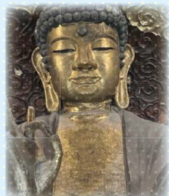
▲優しい瞳に癒されます☆