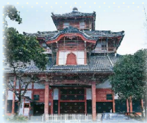
▲この建物にあの大きさの大仏は圧巻です

中に入ると想像を超えるその大きさに圧倒されます。寺院が窮屈ではないのかと思われるほどの圧倒感。「大銀杏を芯柱とし、木材で骨格を組んだのち、外部は竹材で表層は竹材で編み、粘土をぬった…」という説明は読んでいましたが、なによりそのお優しいお顔立ち👉