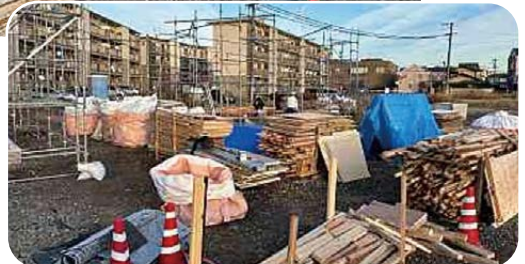
▲見事に解体されました