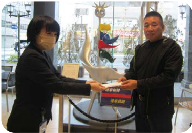
▲総支部長自ら岐阜新聞へ直接手渡し

△イベント収益などから 建連岐阜建設労働組合本巢 支部が、イベント収益と経費か ら計10万円。