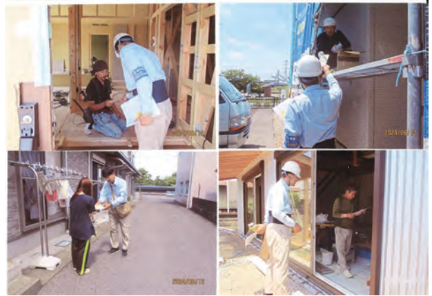
▲地道な活動、ありがとうございます😊