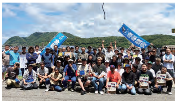
▲見てください この盛り上がり!!