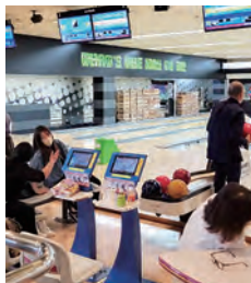
▲老若男女和気あいあい