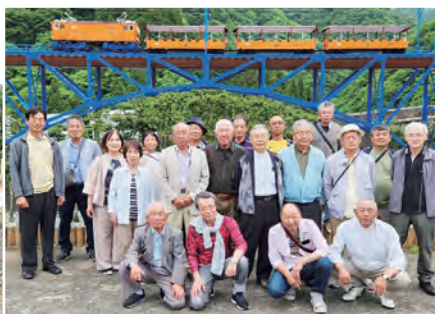
▲宇奈月温泉にて みなさんと楽しそう!